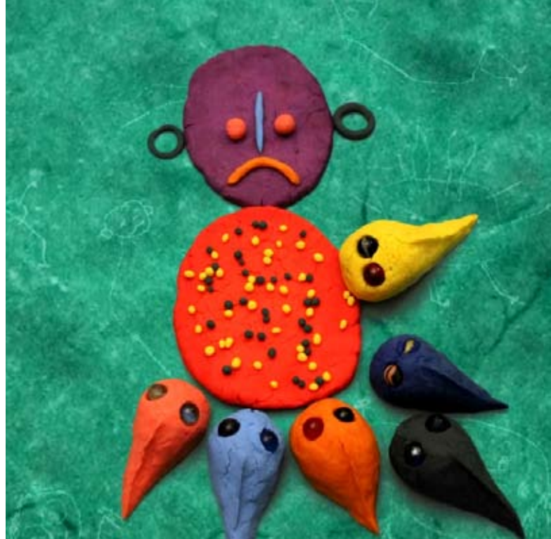
Film d'animation © veronolo - Ph Blanc «Pour dessiner un bonhomme»