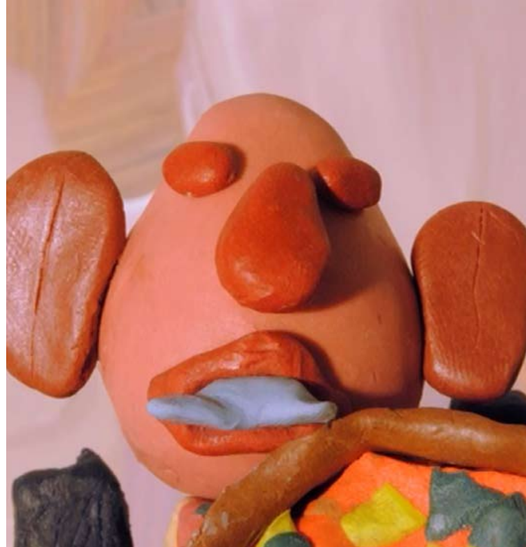
Film d'animation «L'ogre» © Lucie Mousset