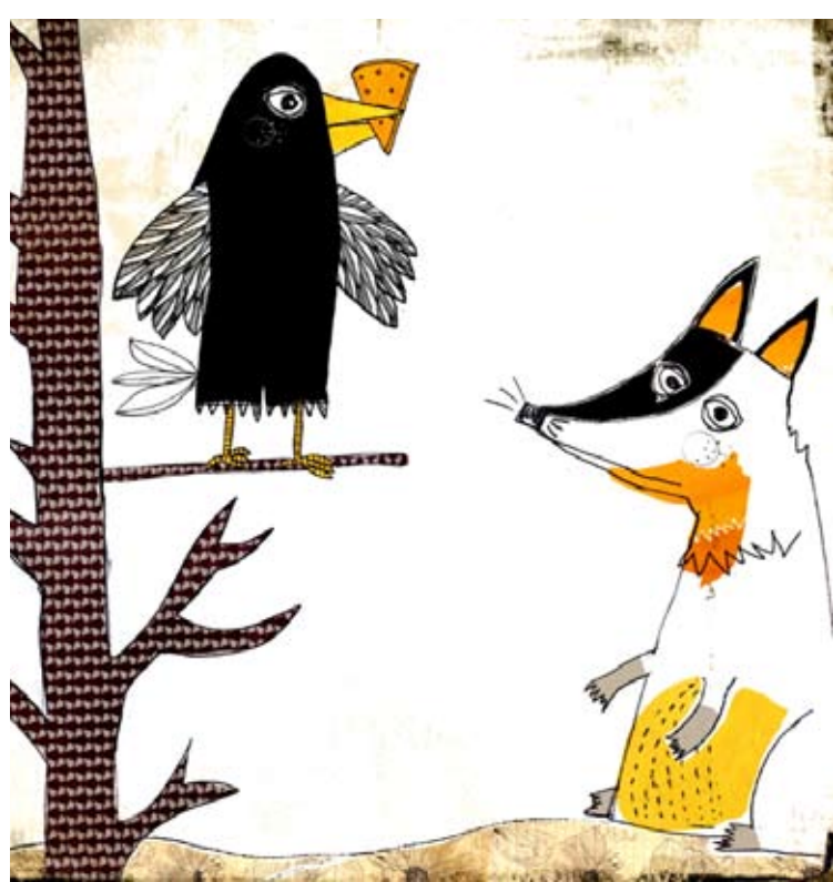
Film d'animation © Mélanie Montaubin «Le corbeau et le renard»