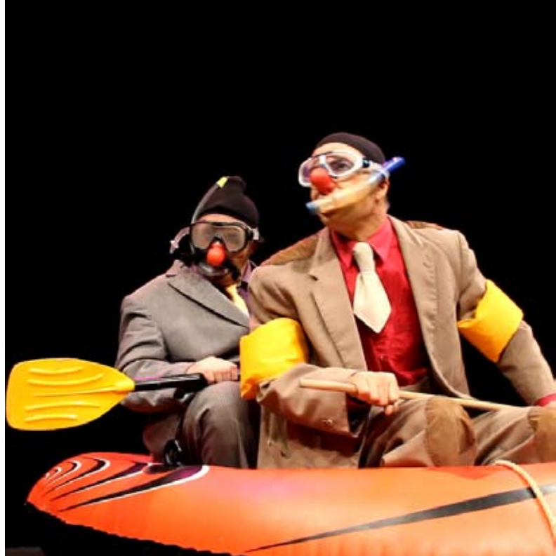
«Le bonheur est dans le pré» © Trotтино Clowns