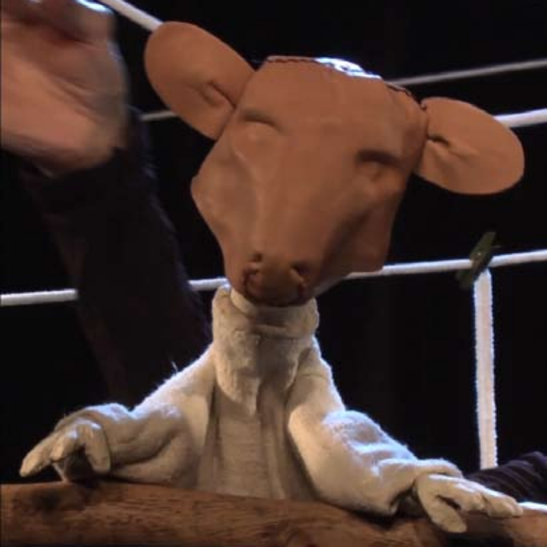
«Le loup déguisé en agneau»