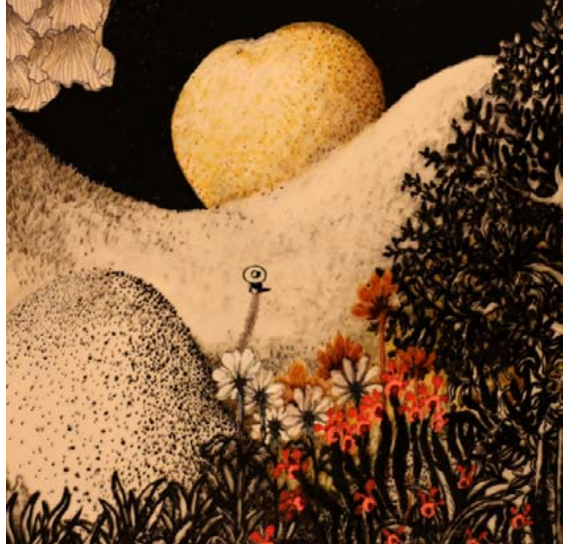
Film d'animation «Le petit géant et l'océan» © Jeanne Mathieu-Julien Dexant