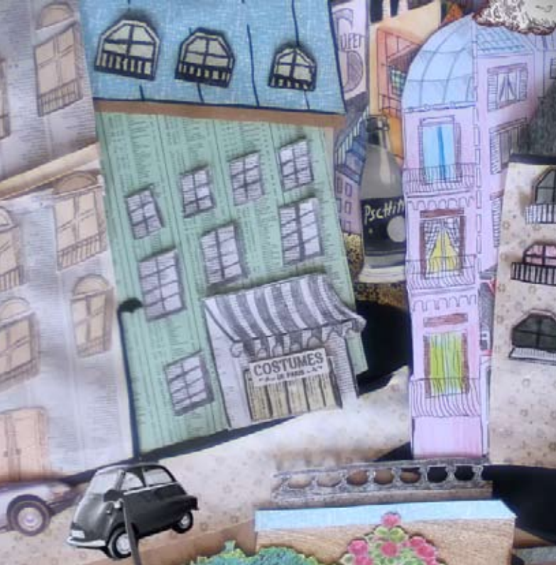
Film d'animation «Dans Paris»