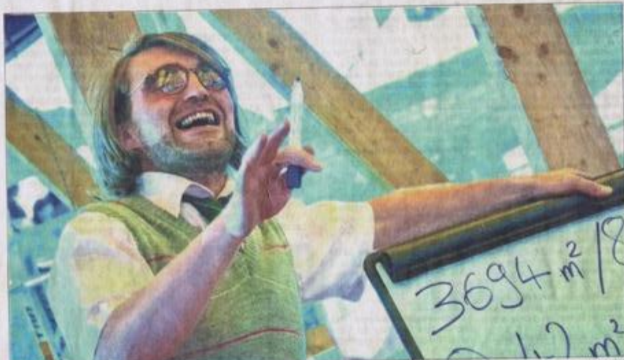
Le public s'invite dans l'histoire et participe à une représentation unique et mouvementée.